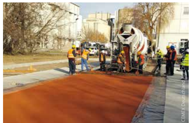
Betonage einer Parkfläche mit farbigem Pervia® Top

Was bringt ein versickerungsfähiger Untergrund, wenn die Oberfläche versiegelt ist? Pervia® Top als Dränbetondeckschicht bietet hier die entsprechende Lösung. Durch die Offenporigkeit von Pervia® Top ist ein ausgezeichnetes Wassermanagement gegeben und somit wird das Risiko von Aquaplaning und Sprühwasserbildung signifikant verringert. Aufgrund der Formstabilität des Baustoffes – auch bei hohen Temperaturen – entstehen deutlich weniger Spurrinnen; das dient ebenfalls der Verkehrssicherheit. Der Lärmentwicklung durch Reifenabrollgeräusche wird durch Pervia® Top mit seiner hervorragenden Offenporigkeit entgegengewirkt. Pervia® Top ist bei verschiedenen Anwendungsgebieten einsetzbar und bei Bedarf auch pigmentiert verfügbar. Wichtig für den Einsatz von Pervia® Top ist ein tragfähiger und durchlässiger Unterbau wie bspw. Pervia® Classic.