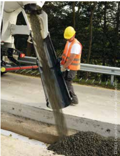
Straßenbankett BAB 1 aus Dränbeton